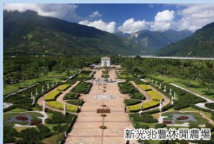
新光兆豐休閒農場

》 新光兆豐休閒農場 ：設有多種遊樂設施、放牧區、生態鳥園、鸚鵡園等，廣大遼闊的青青草原可以讓人盡情跑跳是您全家休閒旅遊的最佳去處。